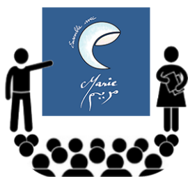
Les Classes Ensemble avec Marie

L'année 2023 était la 2ème année des Classes Ensemble avec Marie . L'intérêt pour notre mission se confirme. Non seulement les demandes ont continué en 2023, mais elles ont même progressé. Les animateurs ont effectué 129 interventions dans 22 établissements différents (écoles privées sous contrat), rencontrant au total 3264 élèves, soit une hausse de 38 % par rapport à l'année 2022. Ce sont plus de 50 établissements qui sont concernés depuis le lancement de cette mission. La plupart sont des établissements catholiques sous contrat, mais le pourcentage de jeunes musulmans est souvent très élevé. Le module largement plébiscité est celui intitulé : "Choisir la fraternité". Les taux de satisfaction, que ce soit de la part des élèves ou des établissements sont excellents :